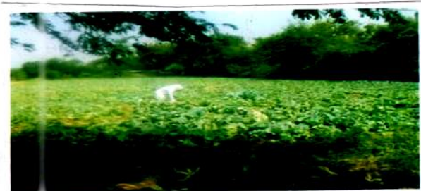
सबजी क्षेत्र विस्तार (पत्तागोभी) वर्ष 2015-2016 रकबा 0.5 हेक्टर